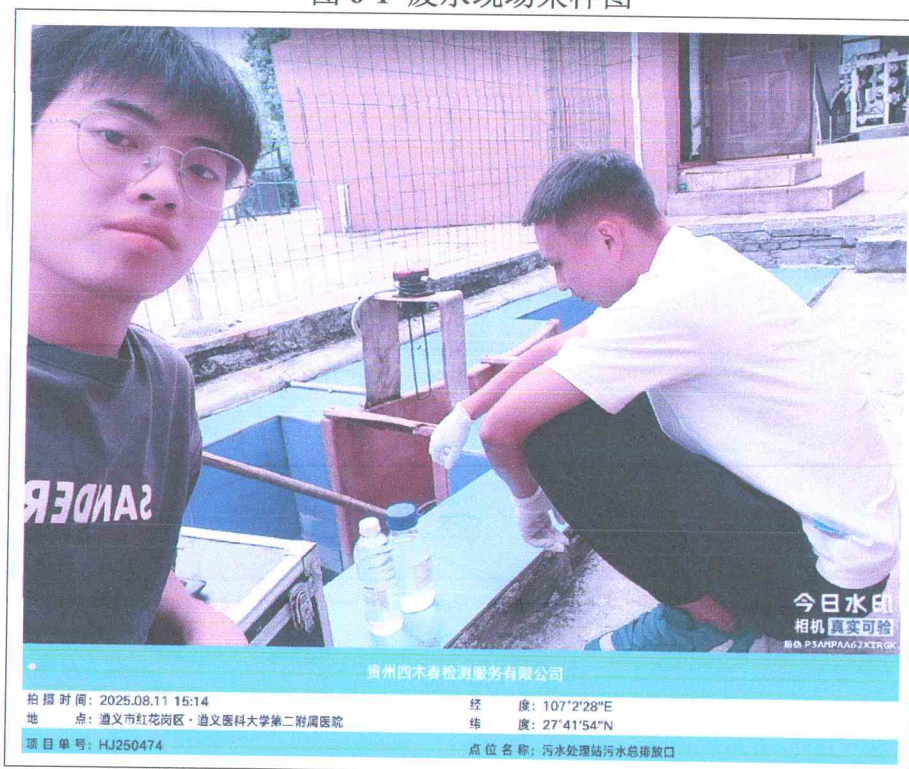
图 6-1 废水现场采样图