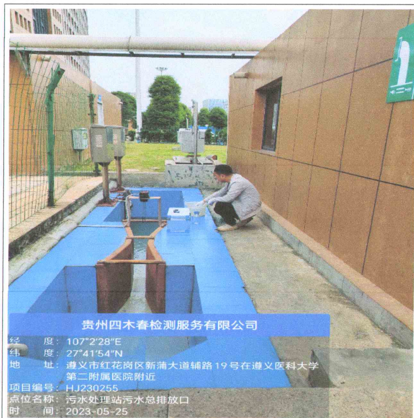
图 6-1 废水现场采样图