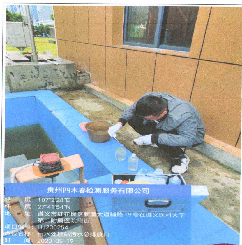
图 6-1 废水现场采样图

编制人: 罗梅梅 审核人: 赵恩 签发人: 陈超 签发日期: 2023.05.19