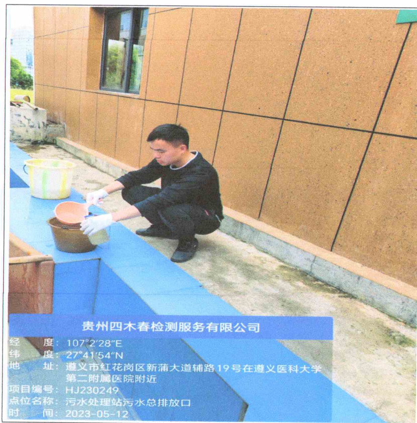
图 6-1 废水现场采样图