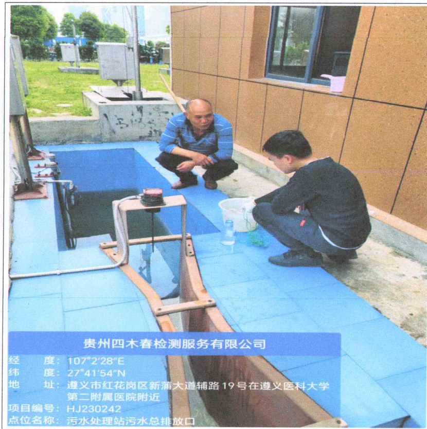
图 6-1 废水现场采样图